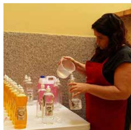
FÁBRICAS DE DETERGENTES